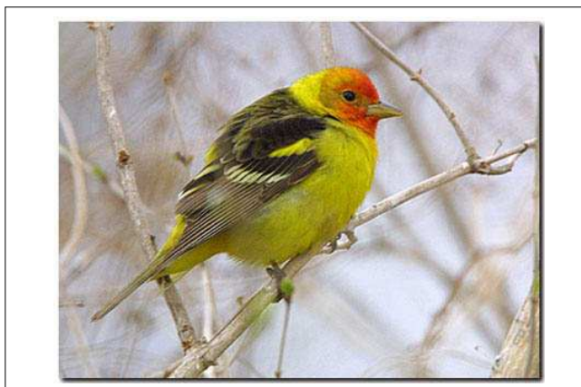
Tangara à tête rouge— Squatec 14 mai 2002

Si vous désirez en savoir plus sur les espèces rares ou inusitées qui visitent le Québec, consultez la page web suivante : http://pages.infinit.net/simaridl/lesoiseauxraresduquebec.htm .