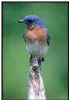
Merle-bleu de l'Est