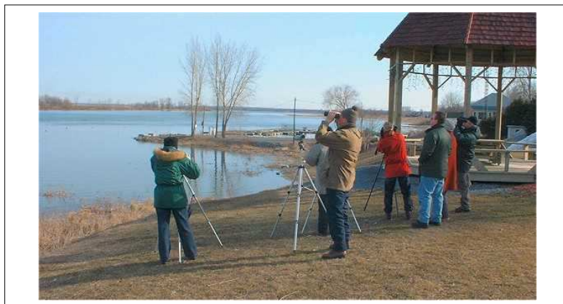
Une sortie aux Rapides de Lachine, le 7 avril 2002

Pour toutes les sorties, il est bon de prévoir les vêtements appropriés (plus que moins), de bonnes chaussures de marche , un ou deux très bon lunchs , chasse-moustiques, crème solaire et, bien sûr, vos jumelles !