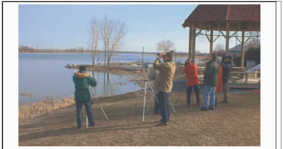
Une sortie à Contrecoeur, le 7 avril 2002