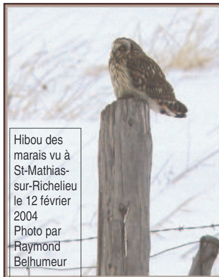
Hibou des marais vu à St-Mathias-sur-Richelieu le 12 février 2004