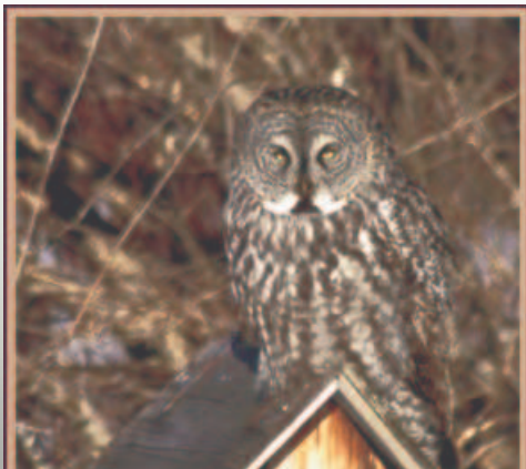
Chouette lapone au cap Tourmente, le 15 février 2004.

Pour en voir plus, consulter le site www.aggo.qc.ca et choisissez : « Les oiseaux