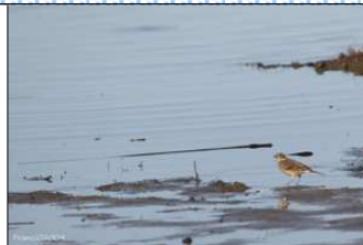
Pointe Yamachiche 2009

ques rencontres avec les êtres humains lui redore un peu le blason auquel il manque encore beaucoup de fleurons avant qu'il s'approche le moins du monde de la renommée du Bruant des neiges et encore davantage de celle du Cardinal rouge.