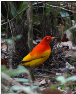
Jardinier du Prince d'orange Papouasie, Nouvelle-Guinée

Il y a trois composantes principales des systèmes vivants sur terre : les gènes, les espèces et les écosystèmes. Cinq causes expliquent le déclin de la biodiversité : la modification des habitats naturels, la surexploitation des ressources, la pollution, l'introduction des espèces exotiques et la modification climatique. La proportion des modifications des espèces est la suivante : 76 % des plantes, 6 % des insectes, 2 % des mollusques. Il y a des zones fortement menacées comme, entre autres, l'Indonésie, le Brésil (40 % d'oiseaux disparus) et la Polynésie française (40 %). [...]