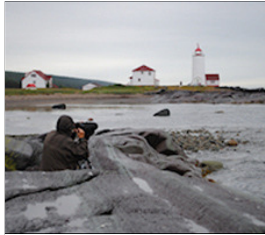
Le phare à l'Île verte